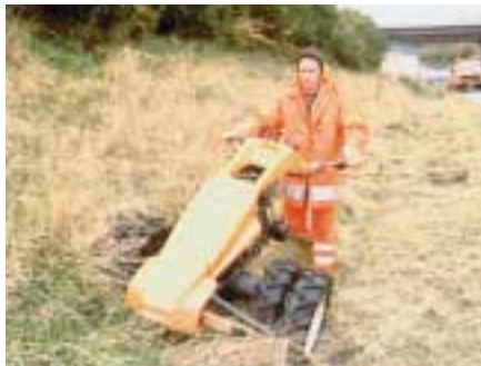
Arbeiten mit dem Balkenmäher auf Böschungen

Für diesen Einsatz fordern die einschlägigen Vorschriften besondere technische Ein-