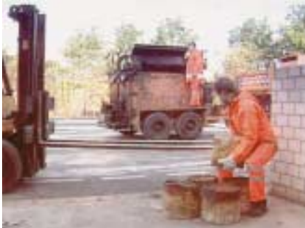
Richtiges Heben schwerer Lasten aus den Knien heraus mit geradem Rücken

schwerer Granitbordsteine verstärkt dabei die einseitige Belastung der Wirbelsäule erheblich. Des Weiteren sind die Gebinde für Baustoffe, Bitumen, Salz etc. des öfteren noch nicht auf kleinere Größen umgestellt.