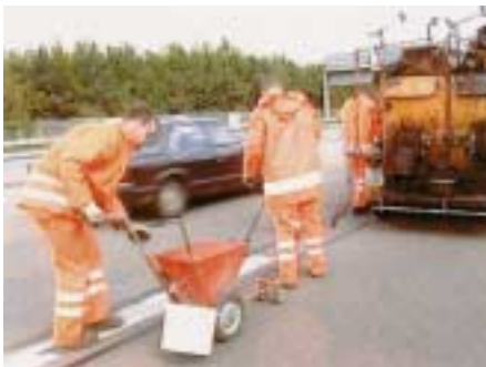
Fugenvergussarbeiten unter Verkehr

Nicht ohne Probleme sind Wartungs- und Reparaturarbeiten dann, wenn sie in unmittelbarer Nähe vorbeifahrender Fahrzeuge durchgeführt werden müssen. So kommt es z.B. bei Arbeiten an den Fahrbahnfugen