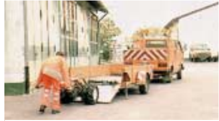
Auffahren eines Einachsschleppers auf einen Niederfluranhänger über eine speziell dafür konstruierte Bordwand.

sie vom Hersteller an zentraler Stelle oberhalb des Schwerpunkts mit einem entsprechenden Anschlagpunkt oberhalb des Schwerpunktes ausgerüstet wurden, in den der Kranhaken direkt eingehängt werden kann.