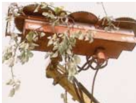
Spezialgerät zum Lichtraumprofil schneiden