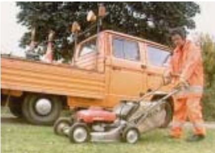
Gehörschutz beim Umgang mit lauten Maschinen

Besondere Bedeutung kommt dem Gehörschutz dann zu, wenn ihn Fahrzeugführer (z.B. von selbstfahrenden Arbeitsmaschinen) während der „Teilnahme am Straßenverkehr“ tragen müssen: Hierbei ist es notwendig, dass die Signaldurchlässigkeit des Gehörschutzes gewährleistet sein muss. Vom BIA (=Berufsgenossenschaftliches Institut für Arbeitsschutz und Arbeitsmedizin, St. Augustin) eigens daraufhin geprüfte Gehörschützer erfüllen diese Anforderungen.