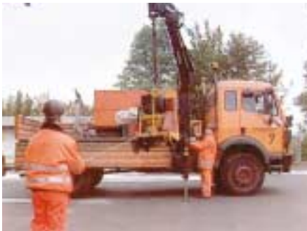
Angeschlagene Lasten von einer gesicherten Position aus führen.

Ohne Ladegeschirre lassen sich neuere Maschinen, wie z.B. Rüttelplatten, kleine Walzen und Kompressoren heben, wenn