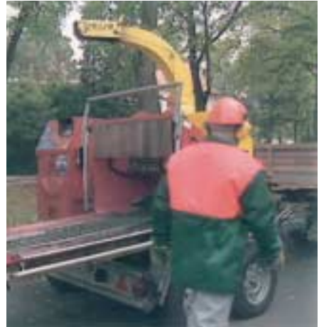
Einsatz eines Buschholzhackers

Für die Beseitigung von Betriebsstörungen jeglicher Art ist unbedingt zu beachten, dass der Antriebsmotor der Maschine abgestellt und eine vorhandene Hydraulikanlage drucklos gemacht wird, bevor in den Wirkbereich der Schneidwerkzeuge eingegriffen wird.