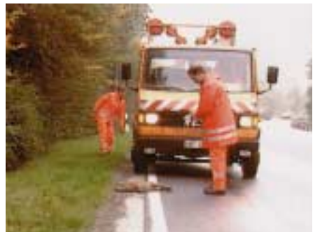
Einsammeln von Tierkadavern

Tiere, die überfahren wurden, müssen von der Straße entfernt werden. Auch hierfür werden in den Bundesländern unterschiedliche Verfahren angewendet. Vielfach ist es notwendig, dass das Unterhaltungspersonal die Kadaver einsammeln und in Beseitigungsanstalten bringen muss. Entsprechende Schutzausrüstung ist dafür von den Straßenwärtern im Fahrzeug mitzuführen.