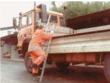
Aluminium-Leiter mit rutschhemmenden Stollen und Holmverlängerung

Wenn das Fahrzeug von Hand be- oder entladen werden muss, fallen verschiedene Arbeiten direkt auf der Ladefläche der Fahrzeuge an. So ist z.B. das Ladegut zu verzurren oder es sind Maschinen und Geräte platzsparend zu verstauen. Hierfür sollten im Bereich der Bordwände geeignete Aufstiegshilfen fest angebracht sein, denn nicht immer ist eine Leiter zur Stelle. So rutschen z.B. die Beschäftigten häufig ab, wenn sie über die Hinterräder aufklettern oder direkt