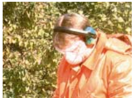
Voller Einsatz von persönlicher Schutzausrüstung mit Staubmaske

Ist darüber hinaus entsprechende Staubentwicklung zu erwarten, muss im Einzelfall die Ausrüstung noch um geeigneten Atemschutz, wie z.B. eine Staubmaske ergänzt werden.