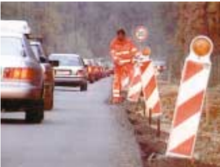
Warnkleidung in Tagesleuchtfarbe und mit retroreflektierenden Streifen.

ten Schutzhandschuhe aus grobem Gewebe mit Innenflächen aus Leder völlig ungeeignet, wenn z.B. mit Lösemitteln (Kraftstoff, Kaltreiniger, Verdüner, Tri) gearbeitet werden muss. Gleiches gilt für Schweißarbeiten aus Gründen der Brennbarkeit und Isolierung gegen Hitze. Dafür gibt es spezielle Handschuhe, die vollständig aus Leder und mit langen Stulpen gefertigt sind.