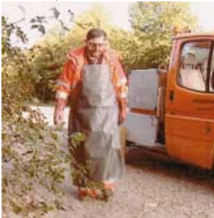
Einsammeln von Behältnissen mit unbekanntem Flüssigkeiten

Genauso wie Flüssigkeiten unbekannter Herkunft und Zusammensetzung auf öffentlichen Parkplätzen und in Waldstücken