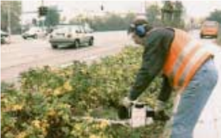
Heckenschneiden mit Motorgerät

Beim Heckenschneiden treten häufig Verletzungen auf, wenn sich die Beschäftigten an Dornen stechen, wenn ihnen Fremdkörper in die Augen fliegen oder wenn sie von Insekten, wie z.B. Wespen gestochen werden. Durch Einführung der Zweihandschaltung bei den Heckenscheren ist die Maschine selbst erfreulicherweise als Unfallursache ziemlich in den Hintergrund getreten. Die Tätigkeit stellt jedoch eine starke Belastung für die Wirbelsäule dar, da die Maschinen oft sehr schwer sind. Dies ist insbesondere dann der Fall, wenn sie mit einem Verbrennungsmotor ausgestattet sind.