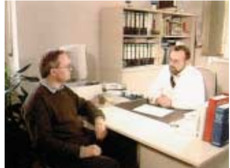
Regelmäßige Betreuung der Beschäftigten durch den Betriebsarzt

Die Gehörschäden stellen dabei die größte Gruppe dar. Dies liegt naturgemäß daran, dass die meisten, im Unterhaltungsdienst eingesetzten Maschinen und Geräte einen entsprechend hohen Lärmpegel verursachen. So liegen z.B. Motorsägen und Trennschneider häufig bei etwa 105 dB(A).