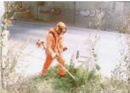
Volle Schutzausrüstung beim Umgang mit der Motorsense

Üblicherweise sind die Beschäftigten im Unterhaltungsdienst mit folgenden persönlichen Schutzausrüstungen ausgestattet: