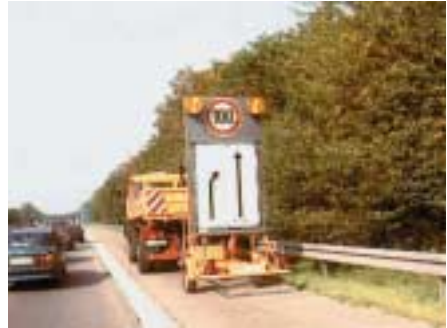
Vorwarntafel als Hinweis auf eine Arbeitsstelle

Wanderbaustellen sind in ihrer Einrichtung immer sehr problematisch, da nur ein geringer Aufwand zur Absicherung getrieben werden kann und sich zudem der gesamte Tross mit Schrittgeschwindigkeit weiterbewegt. Die Abstände zwischen Sicherungsfahrzeug und Arbeitsstelle dürfen dabei nicht zu klein und nicht zu groß sein. Bei zu kleinem Abstand besteht die Gefahr, dass im Falle eines Auffahrunfalles das Sicherungsfahrzeug in den Arbeitsbereich geschoben wird. Bei zu großem Abstand können Fahrzeuge nach dem Sicherungsfahrzeug wieder auf die gesperrte Fahrspur einscheren und auf die Arbeitsstelle prallen. Maße für die zu wählenden Abstände geben die RSA 95 in Abhängigkeit von Sichtweite und Ausbaugeschwindigkeit.