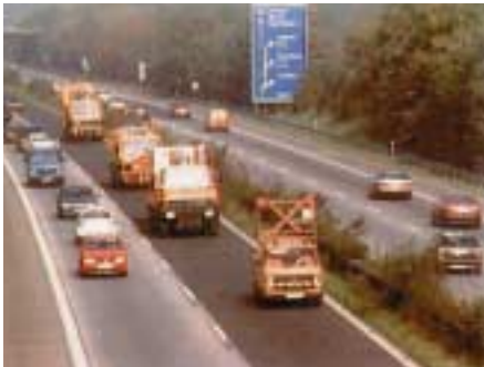
Einrichtung einer Wanderbaustelle auf einer Bundesautobahn

Gleitschutzwand) gegen den direkten Anprall von Fahrzeugen zu sichern. Da jedoch die Revision einer Brücke im Allgemeinen innerhalb eines Tages abgeschlossen ist, sind nur leichte Abschränkungen und die Sicherung durch Warnleiteinrichtungen realisierbar.