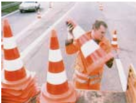
Absperren des Arbeitsbereiches mit Leitkegeln

bildet die rückwärtige Sicherung der eigentlichen Arbeitsstelle. Hier ist darauf zu achten, dass bei höheren Ausbaugeschwindigkeiten der Straße möglichst schwere Fahrzeuge zum Einsatz kommen, um bei einem Aufprall möglichst viel Masse entgegenzusetzen zu können. In vielen Regionen gibt es die Anweisung, dass Zugfahrzeuge der Warnleitanhänger nicht nur schwere LKW sein müssen, sondern, dass diese auch noch bis zur Grenze ihrer Tragfähigkeit beladen zu sein haben. Zum Beispiel wird dieser Forderung dadurch entsprochen, dass das Zugfahrzeug des Warnleitanhängers mit dem zugehörigen Streuautomaten für den Winterdienst ausgerüstet und dieser wiederum voll mit Streusalz befüllt wird.