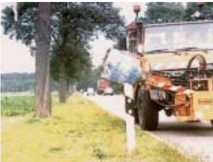
Leitpfostenwaschgerät im Einsatz

Insbesondere zu Zeiten, in denen die Straßen stark verschmutzt werden, also im Frühjahr während Tauperioden, im Herbst zur Erntezeit in ländlichen Gebieten und im Umfeld von Baustellen verschmutzen die Leitpfosten sehr schnell, so dass deren Reflektoren nicht mehr wirksam sind. Leitpfostenwaschgeräte schaffen hier Abhilfe. Da der Geräteträger, an dem das Gerät angebaut ist, im Einsatz etwa alle 50 m anhalten muss, tritt beim konventionellen