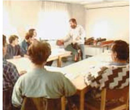
Unterweisung vor Beginn der Arbeiten mit der Motorsäge