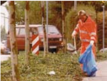
Einsammeln von Abfällen vor Grünpflegearbeiten

immer wieder Getränkedosen von Mähwerkzeugen erfasst und mit großer Wucht weggeschleudert. Kunststoffseile oder Stoffteile können sich um die Werkzeuge wickeln und dort durch Erwärmung so verkleben, dass ein Entfernen nahezu unmöglich wird.