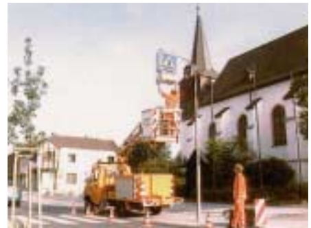
Lampenwechsel an der Beleuchtung eines Fußgängerüberweges

Die Wartung der Beleuchtungseinrichtungen muss im Allgemeinen auch vom Bauhofpersonal vorgenommen werden. Hängen diese in größeren Höhen, sind Hubarbeitskörbe oder Arbeitsplattformen an umgerüsteten Baumaschinen zu verwenden. Provisorien, die für den Wechsel einzelner Lampen „schnell“ einmal erhalten müssen, wie z.B. die Schaufel eines Radladers, sind