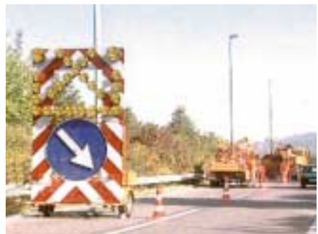
Sicherung einer Arbeitsstelle auf einer Bundesautobahn

Je nach Dauer der Verkehrsbehinderung ist naturgemäß der Aufwand für die Absicherung unterschiedlich. Für Baustellen liefert die RSA detaillierte Aussagen, die auf die verschiedenen Anforderungen auf Bundesautobahnen, sowie auf Straßen außerhalb und innerhalb von Ortschaften eingehen. Arbeitsstellen, die am Ende des Arbeitstages wieder abgebaut werden, sind im Allgemeinen auch in ihrer Länge begrenzt und dadurch überschaubar.