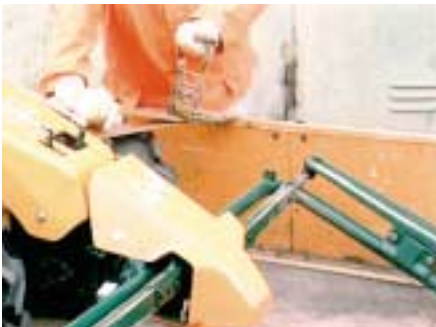
Verzurren einer fahrbaren Maschine mittels Zurrgurt und Spannvorrichtung.

Für den sicheren Transport müssen Lasten auf der Ladefläche sicher befestigt werden. Vor allem fahrbare Maschinen müssen während der Fahrt und insbesondere bei Bremsungen so gesichert sein, dass sie sich nicht selbstständig bewegen können. Hierfür sind viele neuere Transportfahrzeuge bereits mit entsprechenden Ösen ausgerüstet, um ein sicheres Verzurren zu ermöglichen. Fehlen solche Einrichtungen, stellen Zurrgurte mit Spannvorrichtung, die um die gesamte Ladefläche einschließlich Ladung gespannt werden, eine gute Hilfe dar.