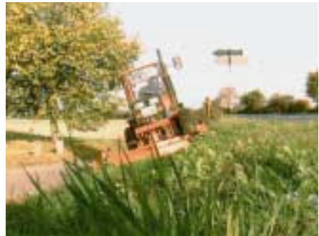
Kleintraktor bei Mäharbeiten

Kleintraktoren mit Mähwerk erleichtern die Bearbeitung größerer Flächen in erheblichem Maß. Durch die Ausrüstung mit Fahrerkabinen ist darüber hinaus für die Beschäftigten eine wesentliche Entlastung von Einflüssen durch Lärm, Staub und Witterung möglich.