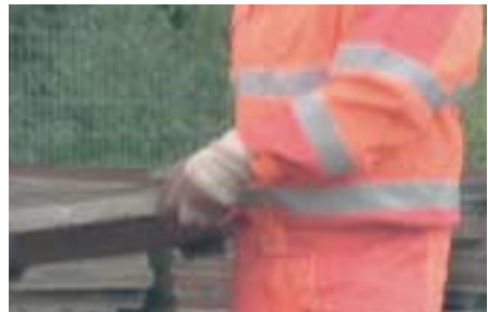
Reflexstreifen auf einem Warnanzug.

Darüber hinaus muss Warnkleidung auch bei schlechten Sichtverhältnissen und bei Dunkelheit vom Fahrer eines Fahrzeuges gut wahrgenommen werden können. Dazu dienen insbesondere Streifen aus retroreflektierenden Materialien, die zur Erhaltung ihrer Eigenschaften auch entsprechend sachkundiger Pflege bedürfen. Reflexstreifen vertragen im Allgemeinen keine hohen Temperaturen. Deshalb darf Warnkleidung nicht zur Kochwäsche gegeben werden. Die auf dem Einnäher jedes Wäschestücks der Warnkleidung aufgedruckte Waschanleitung gibt über die erforderlichen Einzelheiten Auskunft.