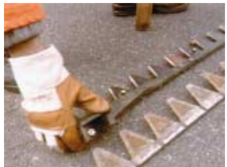
Schutzhandschuhe beim Handhaben von Mähmessern

Verboten ist dagegen der Gebrauch von Schutzhandschuhen bei Arbeiten an Kreissäge oder Ständerbohrmaschine. Hier ist die Gefahr, beim Hängenbleiben mit dem Handschuh von der Maschine erfasst und eingezogen zu werden höher anzusetzen, als die Gefahr sich am Werkstück zu verletzen.