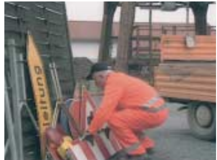
Heben von Lasten aus der Hocke heraus.

Besondere Bedeutung kommt, wie in vielen anderen Bereichen des Arbeitsschutzes auch, im Straßenunterhaltungsdienst dem Heben und Tragen schwerer Lasten zu. So müssen vielfach Fahrzeuge von Hand be- und entladen werden. Dies trifft insbesondere für die Lieferwagen zu, die häufig von den motorisierten Straßenwärtern benutzt werden, und die vielfach auch bei den Kommunen auf Grund ihrer Wendigkeit und Flexibilität zum Einsatz kommen. Sie sind im Allgemeinen nicht mit Hilfseinrichtungen, wie z. B. einem Ladekran ausgestattet.