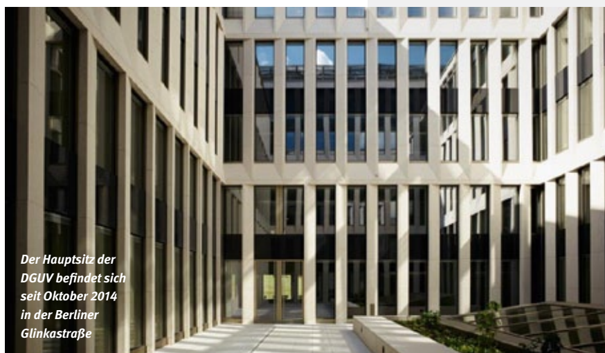
Der Hauptsitz der DGUV befindet sich seit Oktober 2014 in der Berliner Glinkastraße

Im ausgehenden 19. Jahrhundert gegründet, ist die gesetzliche Unfallversicherung ein wichtiger Grundpfeiler der sozialen Sicherungssysteme in Deutschland. Heute sind Arbeitnehmer, Auszubildende, Schüler in allgemein- und berufsbildenden Schulen, Studierende, Kinder in Tageseinrichtungen, aber auch Feuerwehrleute, Haushaltshilfen oder ehrenamtlich Tätige gesetzlich unfallversichert – insgesamt mehr als 75 Millionen Menschen. Charakteristisch für die Organisationsstruktur der DGUV ist die Selbstverwaltung und die Mitbestimmung. Die Mitgliederversammlung aus Vertretern der Berufsgenossenschaften und Unfallkassen wählt den Vorstand der DGUV und überträgt dem Ver-